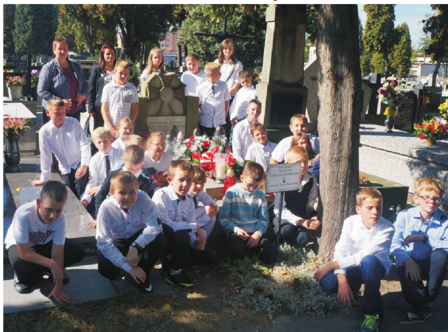
Uczniowie z nauczycielami przy grobie Generała w Nowym Sączu