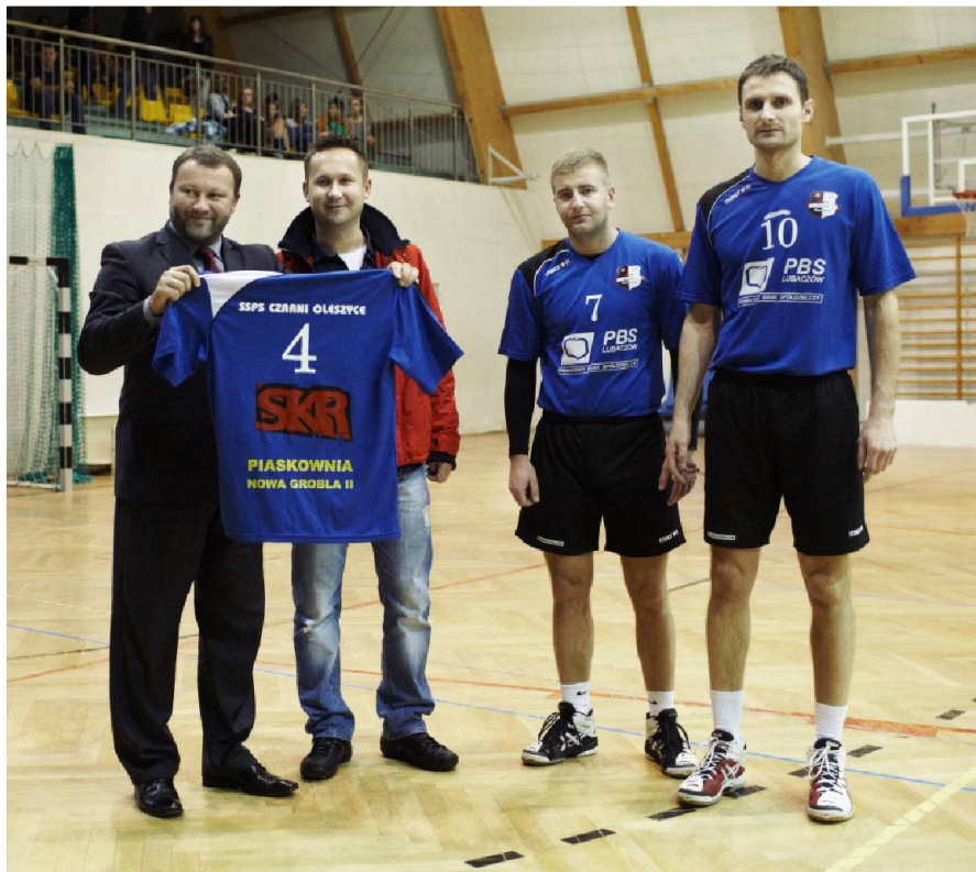
fot. Sponsorzy podczas przekazywania nowych strojów siatkarzom