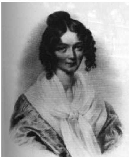
Celestyna Gryzelda Działyńska

W tych poczynaniach wspierała męża Celestyna Działyńska. Prowadziła szkołę dla dzieci oraz towarzystwo trzeźwości, dla opieki nad ludem osiedliła zgromadzenie sióstr Felicjanek. Tytus miał żartować z tej