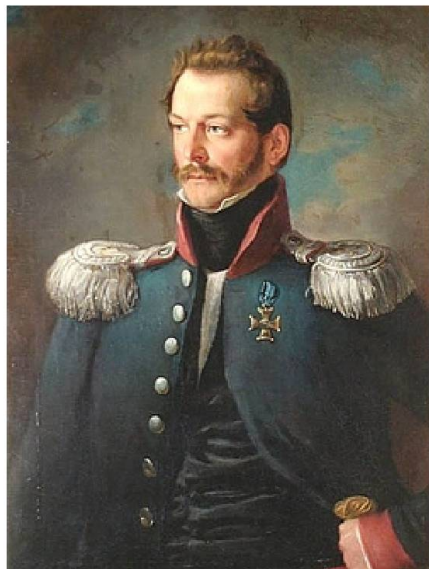
Portret Tytusa Działyńskiego, ok. 1831 r.