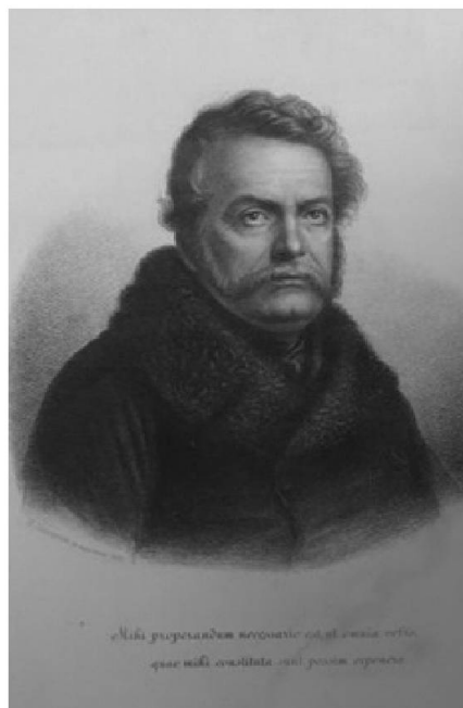
Tytus Działyński, lata 1850

Z myślą o niej, Działyński w 1842 r. ufundował szkołę w Starych Oleszycach, a w 1844 r. położył kamień węgielny budynku dla oleszyckich proboszczów. Inwestycje w Oleszycach były na tyle spore, że kiedy Działyński odzyskał po wielu latach majątek kórnicki, jego małżonka niechętnie opuszczała Oleszycy.