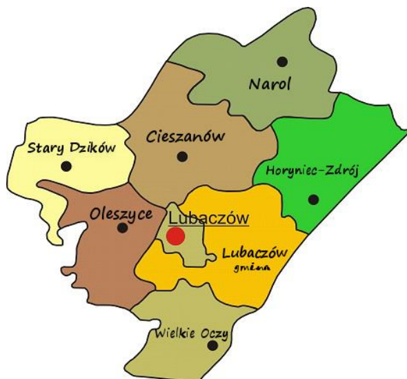
Rysunek 1 Położenie Miasta i Gminy Oleszyce na tle powiatu Lubaczowskiego

Łączny obszar jaki zajmuje gmina Oleszyce wynosi 151,87 km 2 , w tym miasto Oleszyce zajmują 5,0 km 2 . Rozciąga się na przestrzeni 16 km na linii północ-południe i około 10 km na linii wschód-zachód.